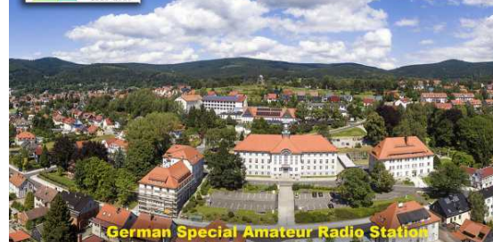
German Special Amateur Radio Station