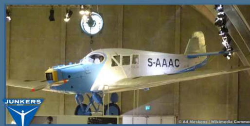
Stockholm Tekniska Museet Junkers F13